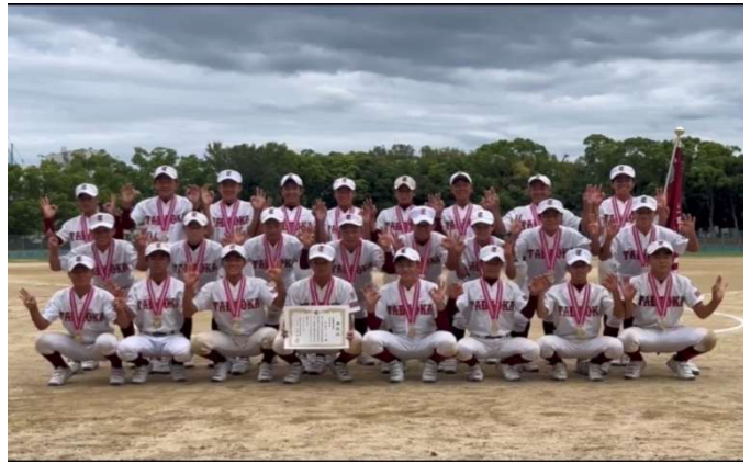
第53回関西秋季大会支部予選 代表