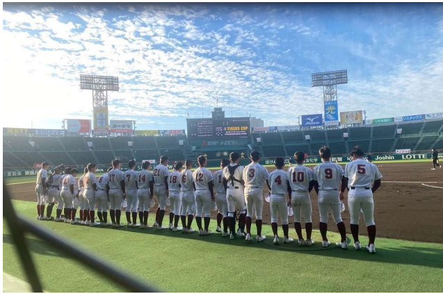
第19回タイガースカップ 甲子園球場