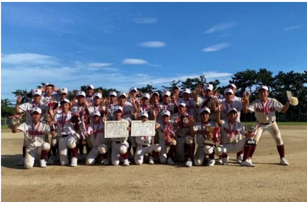
第14回K・Tふみづき大会 Jr 優勝・準優勝